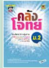
คลังโจทย์ ม.ต้น ราคา 299 บาท

ชุด TOP เป็นหนังสือสรุปเนื้อหาสำคัญ ตามหลักสูตรในแต่ละวิชาของแต่ละระดับชั้นพร้อมแบบฝึกหัดท้ายบท เหมาะสำหรับนักเรียนใช้อ่านทบทวนความรู้อย่างมีประสิทธิภาพ เพื่อผลการสอบที่ยอดเยี่ยม