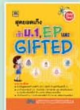
ชุดยอดเก่งเข้า ม.1 ราคา 159 บาท

มีวางจำหน่ายที่ร้านหนังสือชั้นนำทั่วประเทศ หรือสั่งซื้อโดยตรงที่