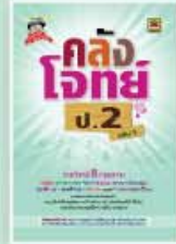
คลังโจทย์ประถม ราคา 199 บาท