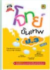
โจทย์ขั้นเทพ ประถม ราคา 199 บาท

สำหรับใช้เปรียบเทียบเพื่อประเมินความสามารถของตัวเองในแต่ละวิชาได้อย่างชัดเจน จัดพิมพ์หลายเล่ม แยกตามระดับชั้น โจทย์ครอบคลุมและพลิกแพลงหลายรูปแบบ เพื่อความเป็นเลิศเหนือระดับ พร้อมเฉลยละเอียดเข้าใจง่าย เหมาะสำหรับใช้เตรียมสอบเพื่อวัดพื้นฐานความรู้, สอบคัดเลือกเข้าเรียนต่อ และสอบแข่งขันในทุกสนาม!