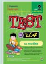
TEST ป.4-ป.6 ราคา 79 บาท

ชุด เตรียมสอบ NT & O NET และสอบเรียนต่อ เพื่อเตรียมสอบ NT & O-NET และ สอบคัดเลือกเข้าเรียนต่อ มีหลายเล่ม