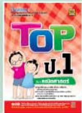
TOP ป.1-ป.3 ราคา 89 บาท

หนังสือทั้ง ชุด TOP และ ชุด TEST จัดพิมพ์ด้วยกระดาษ BOOK PAPER อย่างดี โดยระดับประถมศึกษา แยกเป็น 6 ชั้น ๆ ละ 5 วิชา คือ คณิตศาสตร์, วิทยาศาสตร์, ภาษาอังกฤษ, ภาษาไทย และสังคมศึกษา ดังนี้