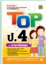
TOP ป.4-ป.6 ราคา 109 บาท