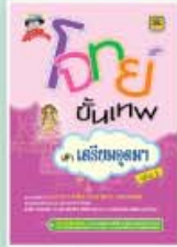
โจทย์ขั้นเทพ ม.ต้น ราคา 299 บาท