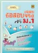
เฉลยข้อสอบจริงเข้า ม.1 ราคา 159 บาท