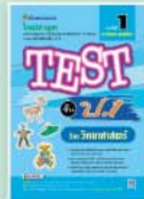
TEST ป.1-ป.3 ราคา 69 บาท