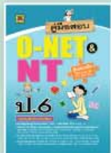
คู่มือสอบ O-NET & NT ชั้นป.6 ราคา 109 บาท

ชุด เตรียมสอบ NT & O NET และสอบเรียนต่อ เพื่อเตรียมสอบ NT & O-NET และ สอบคัดเลือกเข้าเรียนต่อ มีหลายเล่ม