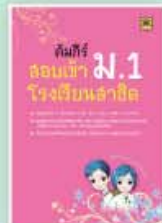
คัมภีร์สอบเข้า ม.1 สาธิต ราคา 299 บาท