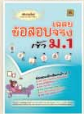
เฉลยข้อสอบจริงเข้า ม.1 ราคา 159 บาท