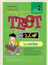
TEST ป.4-ป.6 ราคา 79 บาท

ชุด เตรียมสอบ NT & O-NET และสอบเรียนต่อ เพื่อเตรียมสอบ NT & O-NET และ สอบคัดเลือกเข้าเรียนต่อ มีหลายเล่ม