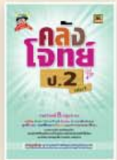
คลังโจทย์ประถม ราคา 199 บาท