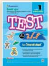
TEST ป.1-ป.3 ราคา 69 บาท