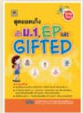
ชุดออกข้อสอบ ม.1 EP และ GIFTED ราคา 159 บาท

มีวางจำหน่ายที่ร้านหนังสือชั้นนำทั่วประเทศ หรือสั่งซื้อโดยตรงที่