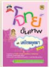
โจทย์ขั้นเทพ ม.ต้น ราคา 299 บาท