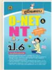
คู่มือสอบ O-NET & NT ชั้น ป.6 ราคา 109 บาท

ชุด เตรียมสอบ NT & O-NET และสอบเรียนต่อ เพื่อเตรียมสอบ NT & O-NET และ สอบคัดเลือกเข้าเรียนต่อ มีหลายเล่ม