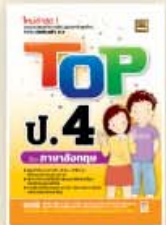
TOP ป.4-ป.6 ราคา 109 บาท