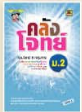
คลังโจทย์ ม.ต้น ราคา 299 บาท

ชุด TOP เป็นหนังสือสรุปเนื้อหาสำคัญ ตามหลักสูตรในแต่ละวิชาของแต่ละระดับชั้นพร้อมแบบฝึกหัดท้ายบท เหมาะสำหรับนักเรียนใช้อ่านทบทวนความรู้อย่างมีประสิทธิภาพ เพื่อผลการสอบที่ยอดเยี่ยม