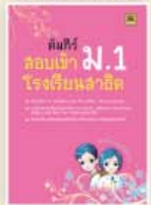
คัมภีร์สอบเข้า ม.1 สาธิต ราคา 299 บาท